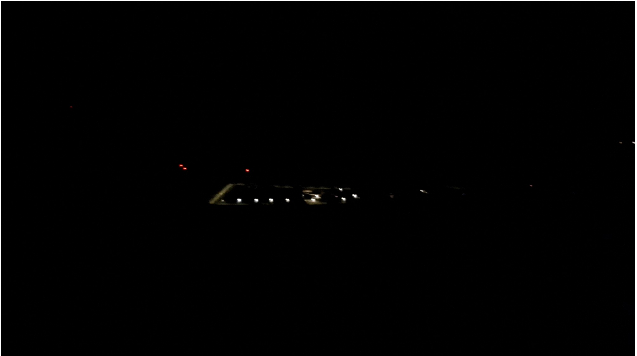
Site du plateau d'Albion de nuit 5 juin 2019

Dernière image ci dessous et conclusion du Compte rendu.