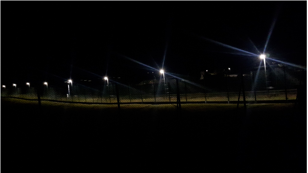
Base prise d'assez loin